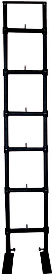
» TORRE DE CALLE TC-6/3000